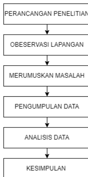
Gambar III.1 Desain Penelitian

Penelitian ini dimulai dari banyaknya keresahan yang ditemukan selama observasi, yang kemudian mengarah pada perumusan masalah. Dari rumusan masalah tersebut, penulis akan menciptakan solusi dengan menetapkan tujuan penelitian. Selanjutnya, rancangan penelitian akan dibuat berdasarkan langkah-langkah yang didasarkan pada permasalahan dan tujuan penelitian tersebut.