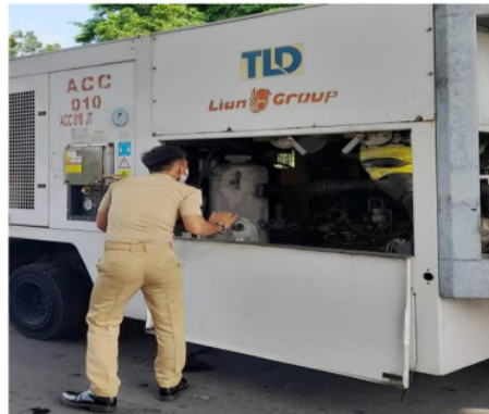
Gambar IV.1 Pemeriksaan Peralatan GSE

Berdasarkan hasil observasi dilapangan pada unit AMC pada tanggal 28 September sampai 30 November Dalam observasi, terlihat bahwa beberapa Peralatan GSE yang digunakan oleh Lion Air telah melewati batas usia pemakaian yang ditetapkan dalam Undang-Undang PM 91 Tahun 2016 Fachrurazi, (2022). Hal ini menunjukkan adanya kegagalan dalam mematuhi persyaratan Regulasi terkait umur maksimal pemakaian Peralatan GSE, ditampilkan pada gambar IV.1 Keberadaan Peralatan yang melebihi batas usia pemakaian dapat menimbulkan risiko keamanan dan kinerja yang tidak Optimal.