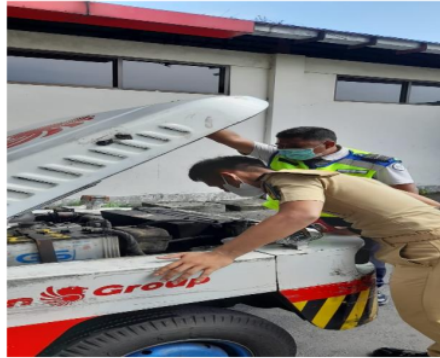
Gambar IV. 2 Pemeriksaan Peralatan